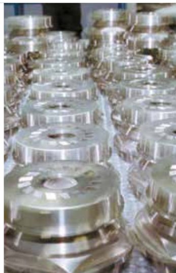
Injecteurs de turbine à gaz