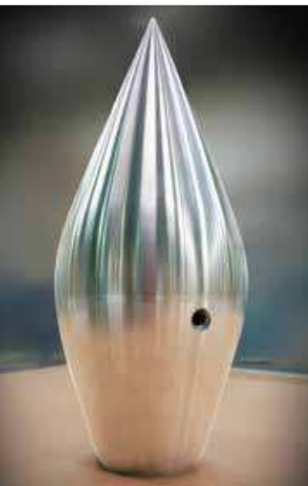
Pointeau pour énergie hydraulique

Aéronautique • Défense • Energie • Pétrole • Plastique • Papeterie Etanchéité • Sidérurgie • Composite