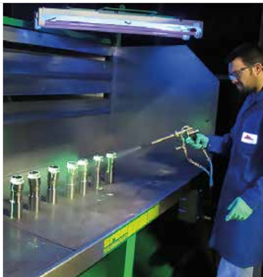
Contrôle fluorescent non destructif