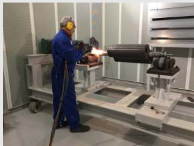
Operation de métallisation

Notre groupe comptait 4 usines toutes ISO 9001, ISO 14001 et pourvues d'une organisation importante, nous permettant de répondre aux attentes de nos clients mais cette structure ne nous permettait plus de répondre aux urgences de réparation.