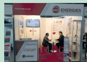
POWERGEN Cologne (juin)