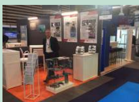
INDUSTRIE LYON (avril)