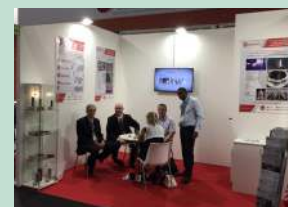
ICE EUROPE - Munich (mars)