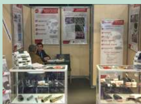
SEPEM - Douai (janvier)