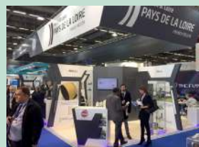
JEC WORLD - Paris (mars)