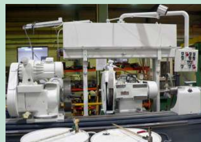
Nouvelle rectifieuse à Polimiroir