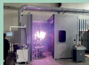
Cabine Plasma à Wujiang