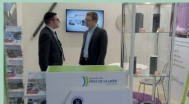
JEC (Paris) - Salon des Composites.