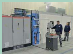
Cabine HVOF à Ouest Coating

Nouvelles cabines HVOF et Plasma à Ouest Coating et à Wujiang pour les marchés de l'énergie.